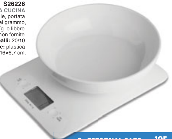
S26226 BILANCIA DA CUCINA in plastica con vaso asportabile, portata massima Kg.3 con frazionamento al grammo, possibilità di lettura in Kg. o libbre. Pile non fornite. Imballi: 20/10 Materiale: plastica Dimensioni: 21,2x16x6,7 cm.