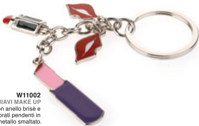
W11002 PORTACHIAVI MAKE UP portachiaivi con anello brisè e simpatici e colorati pendenti in metallo smaltato. In confezione singola. Materiale: metallo