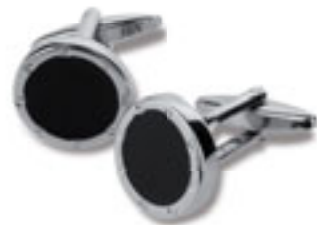
W11350 GEMELLI in metallo con base smaltata. In confezione singola. Materiale: metallo