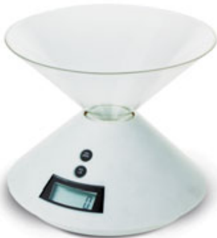
S26225 BILANCIA DA CUCINA in plastica con vaso asportabile e asportabile. Il display è digitale, la portata massima Kg. 3,5 con frazionamento al grammo e possibilità di lettura in Kg. o libbre. Pile fornite. Imballi: 10/5 Materiale: plastica Dimensioni: Ø 17,7x15 cm.