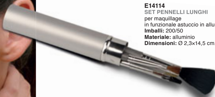
E14114 SET PENNELLI LUNGI per maquillage in funzionale astuccio in alluminio. Imballi: 200/50 Materiale: alluminio Dimensioni: Ø 2,3x14,5 cm.