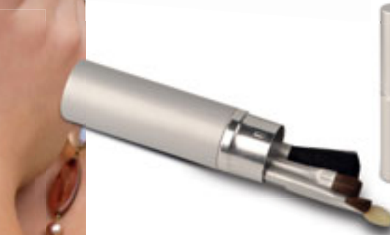
E14113 SET PENNELLI MEDI per maquillage in funzionale astuccio in alluminio. Imballi: 200/50 Materiale: alluminio Dimensioni: Ø 2,3x12,5 cm.