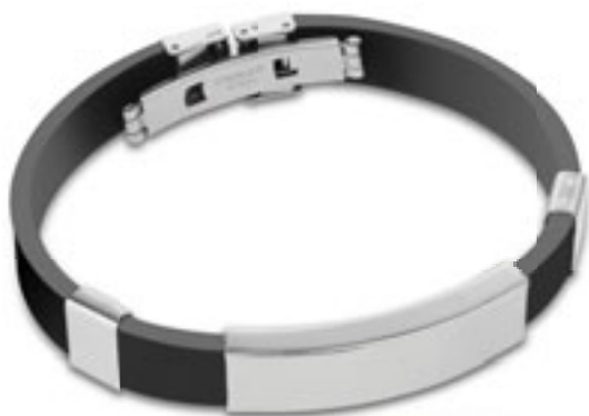
W11302 BRACCIALE IN CAUCCIÙ con particolari in acciaio. In confezione singola. Materiale: acciaio/caucciù