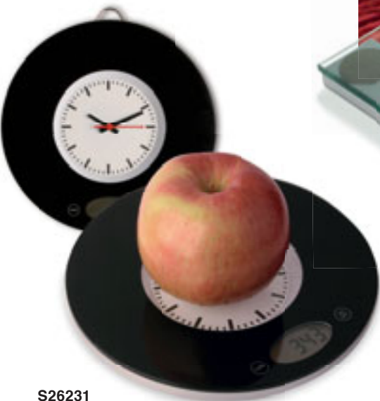
S26231 BILANCIA DA CUCINA con orologio, in vetro temperato, da tavolo e appendibile, portata massima Kg. 3 con frazionamento al grammo, possibilità di lettura in Kg. o libbre. Pile non fornite Imballi: 20/10 Materiale: vetro/plastica Dimensioni: Ø 20x2,2 cm.