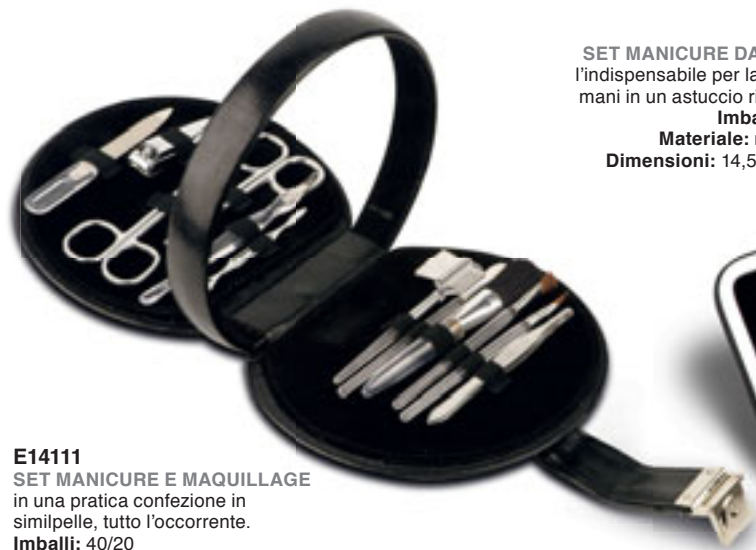
E14111 SET MANICURE E MAQUILLAGE in una pratica confezione in similpelle, tutto l'occorrente. Imballi: 40/20 Materiale: metallo/PU Dimensioni: 14x15x3,5 cm.