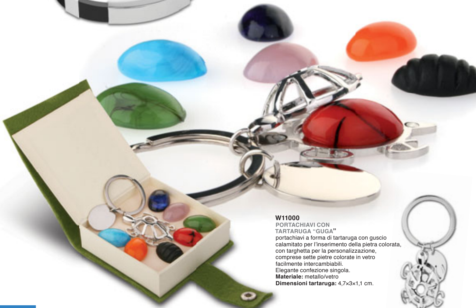
W11000 PORTACHIAVI CON TARTARUGA "GUGA" portachiaivi a forma di tartaruga con guscio calamitato per l'inserimento della pietra colorata, con targhetta per la personalizzazione, comprese sette pietre colorate in vetro facilmente intercambiabili. Elegante confezione singola. Materiale: metallo/vetro Dimensioni tartaruga: 4,7x3x1,1 cm.