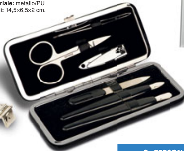
E14112 SET MANICURE DA VIAGGIO l'indispensabile per la cura delle mani in un astuccio rigido in PU. Imballi: 100/20 Materiale: metallo/PU Dimensioni: 14,5x6,5x2 cm.