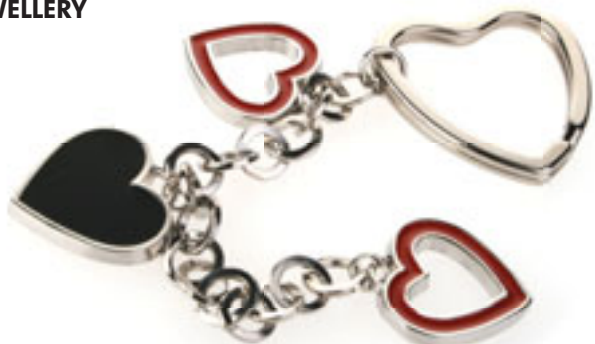
W11001 PORTACHIAVI A CUORE portachiaivi con anello brisè a forma di cuore e tre pendenti a cuore in metallo smaltato. In confezione singola. Materiale: metallo