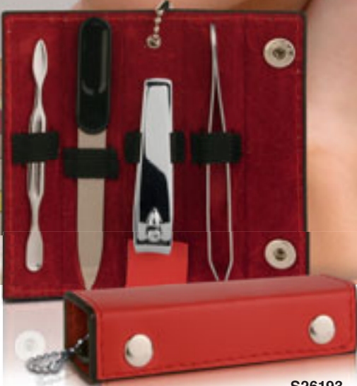
S26193 SET MANICURE DA VIAGGIO l'indispensabile per la cura delle mani in un astuccio in PU. Imballi: 200/50 Materiale: metallo/PU Dimensioni: 9,8x2,5x2,5 cm.