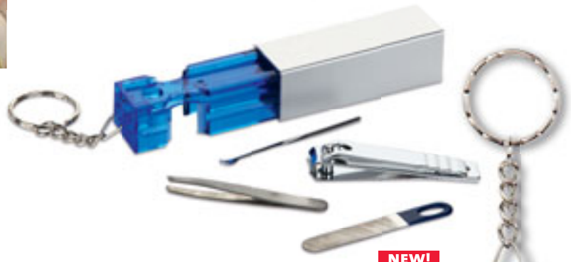
NEW! S26194 SET MANICURE DA VIAGGIO l'indispensabile per la cura delle mani, in astuccio in plastica con portachiavi. Imballi: 200/50 Materiale: metallo/plastica Dimensioni: 7,3x2,2x2,2 cm.