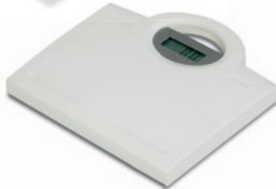
S26220 BILANCIA PESA PERSONE in plastica con piedini antiscivolo. Il display è digitale, la portata minima Kg. 2,5, quella massima Kg. 120. Pile fornite. Imballi: 10/5 Materiale: plastica Dimensioni: 27x25x3,6 cm.