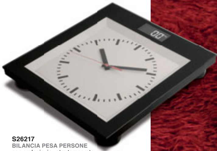
S26217 BILANCIA PESA PERSONE con orologio, in vetro temperato, con piedini antiscivolo, display digitale, portata minima Kg. 2,5, portata massima Kg. 180. Pile non fornite Imballi: 4/2 Materiale: vetro/plastica Dimensioni: 30x32x4,8 cm.